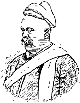
महादेव गोविंद रानडे